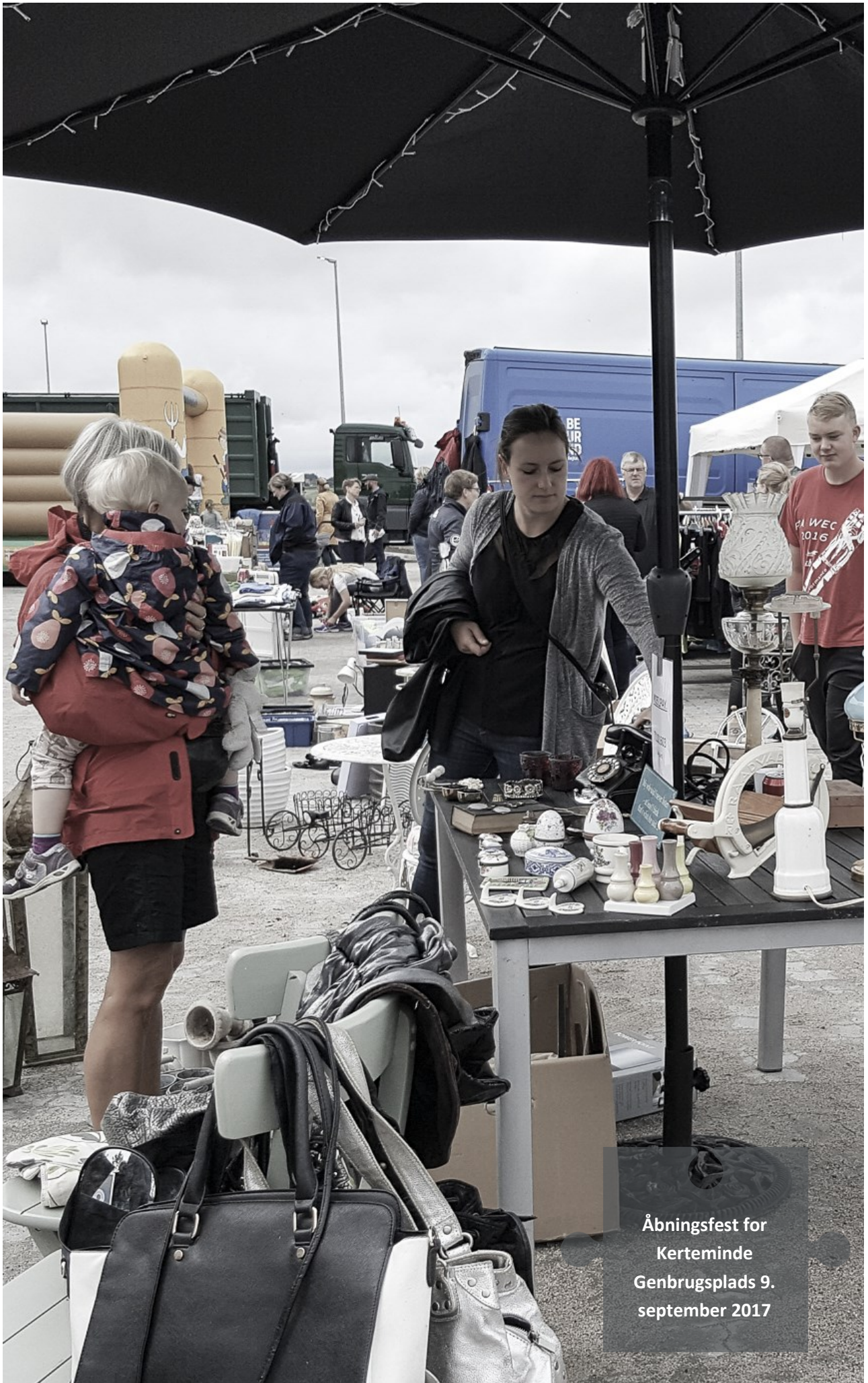
Åbningsfest for Kerteminde Genbrugsplads 9. september 2017